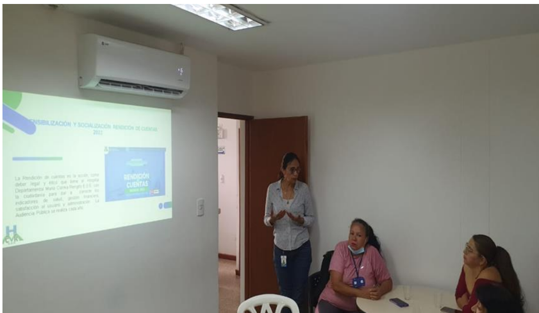
Socialización y Sensibilización Asociación de Usuarios del Hospital Departamental Mario Correa Rengifo E.S.E. tema Rendición de Cuentas julio de 2023