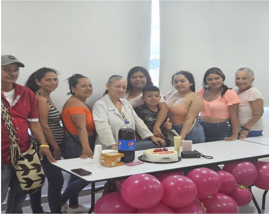
Lideres de la Comuna 18

E2Le Realizar identificación de Lideres locales, grupos organizados comunitarios entidades e instituciones, medios de comunicación identificados en la comuna 18