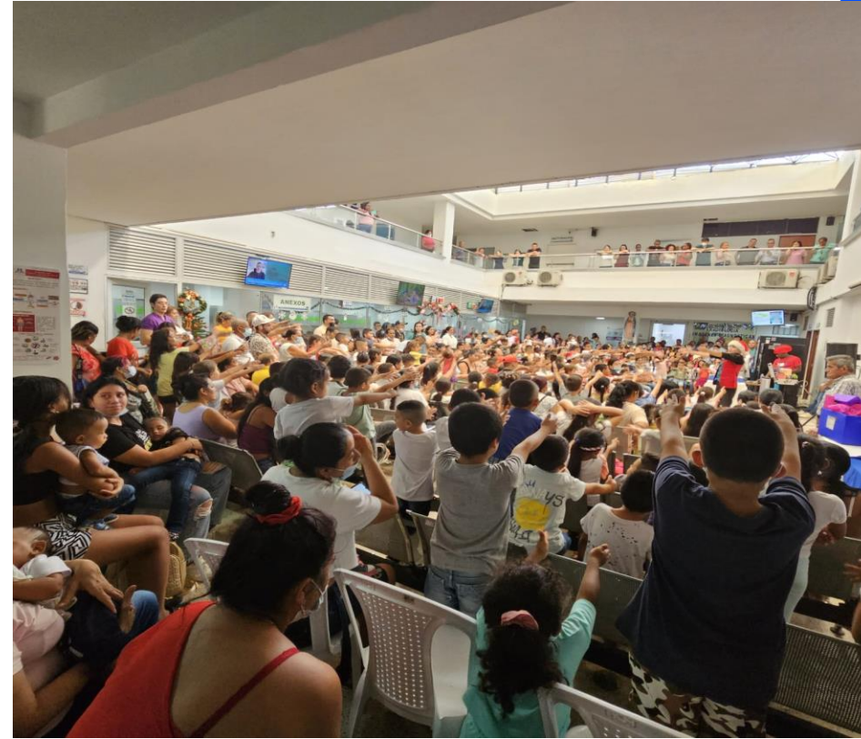
Compartir con la comunidad del sector y los hijos en las novenas del Niño Dios 2023 Sala de Espera del HDMCR